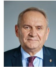
Andrzej Krańcki prezes PKOl