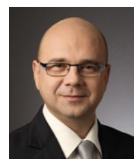
Bartłomiej Chmielowiec Rzecznik Praw Pacjenta