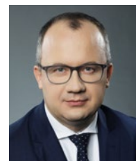
Dr hab. n. pr. Adam Bodnar, prof. SWPS