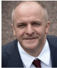
Dr hab. n. spot. Paweł Kowal, prof. ISP PAN