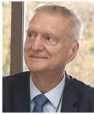
Prof. dr hab. n. tech. dr h.c. multi Michał Kleiber